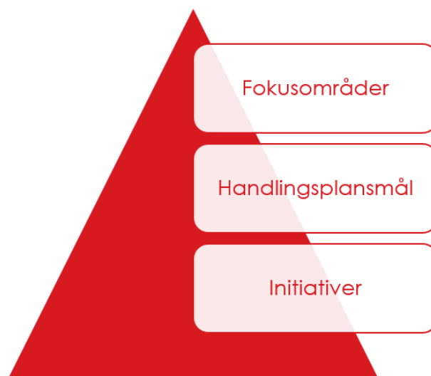
Figur 1 - Opbygning af plan for risikobaseret dimensionering.

For at kunne fastholde planens fokusområder, er der udarbejdet en række handlingsplansmål med afsæt i planens faglige konklusioner. Det er med afsæt i disse mål, at der løbende over den 4årige planperiode, igangsættes initiativer.