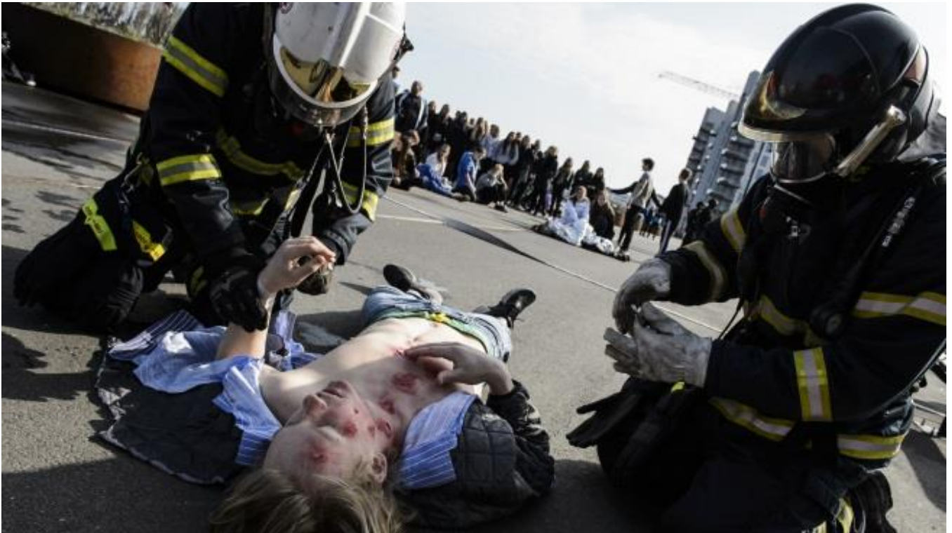
2 brandfolk udøver førstehjælp på en tilskadekommen under terror-øvelsen.

involverede alt fra Nordjyllands Beredskab og Nordjyllands Politi til sundhedsmyndighederne og EOD (Hærens Ammunitionsrydningstjeneste).